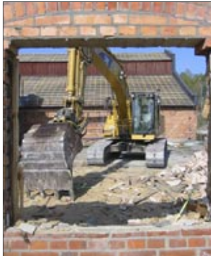
Rivning av rena delar av byggnad