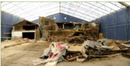
Övre bilden: Tätspont längs Bengtsbrohöljen Nedre bilden: Rivning av förorenad byggnad i tält