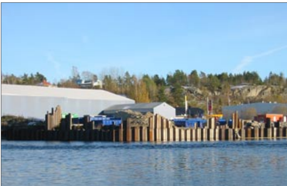
Vid Bengtsbrohöljens strandkant har en tätspont etablerats som skydd mot eventuella föroreningar från EKA-området. Efter saneringen tas sponten mot sjön bort.