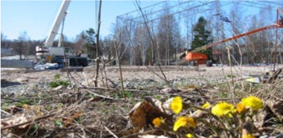
Tältet som var rest över EKA-byggnaden under rivningen har nu tagits bort.

Förberedande arbeten inför den kommande marksaneringen på EKA är färdiga. EKA-byggnaden har rivits och tältet som det senaste året blivit en del av EKAs profil har tvättats och monterats ned.