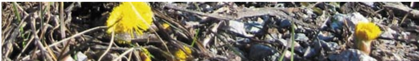
Tussilago på EKA-området