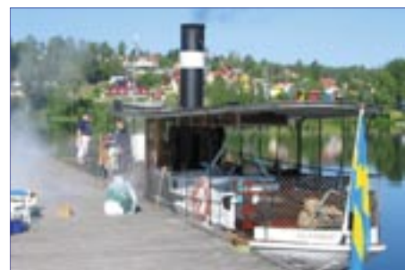
Kanalbåt vid bryggan i Bengtsfors

Parkering för bilar och bussar finns i anslutning till båtarna.