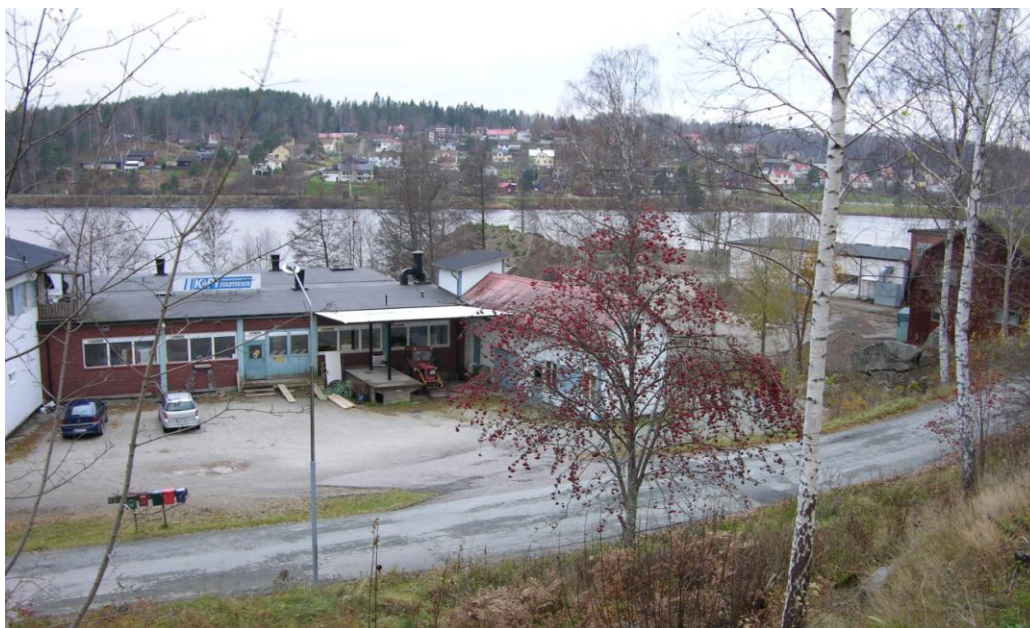
Befintlig bebyggelse på Möbelsnickaren 5.

Med hänsyn till risken för högvatten får tillbyggnader eller inredande av lokaler till bostäder inte ske med lägre grundläggningsnivå för underkant av grundsulan än +92,20 m i det lokala systemet (RH 70 -0.958).