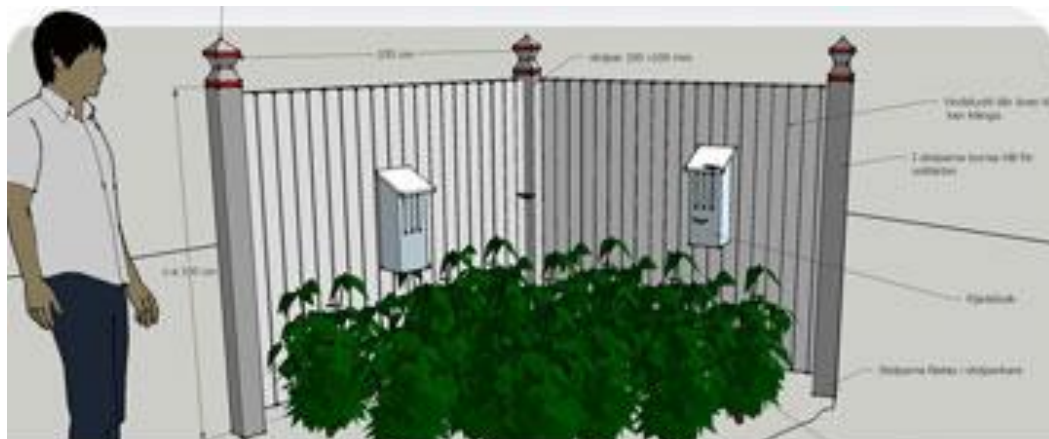
Illustration av en fjärilsstation.

Inom området finns gräsbevuxna slänter och viss lövträdsvegetation. I områdets norra del pågår anläggande av en mindre fjärilspark.